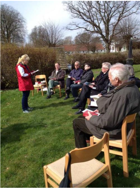
Friluftsgudstjänst i Bollerup