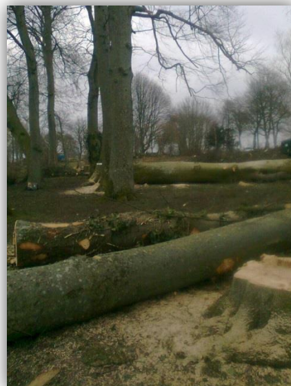
Trädfällning i Kverrestads Bygdegårds park