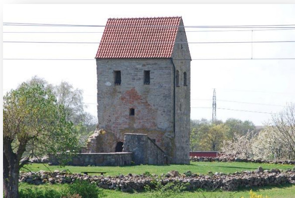
Gökotta i Nedraby kyrkoruin på Kristi Himmelfärds dag