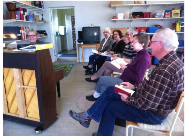
Trivselkören övar i församlingsgården