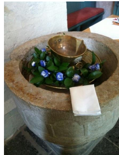
Inför dopgudstjänst i Östra Ingelstad kyrka