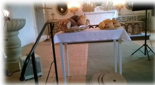
Brödets Gudstjänst i Tosterups kyrka