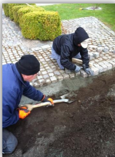
Nit och flit hos våra vaktmästare