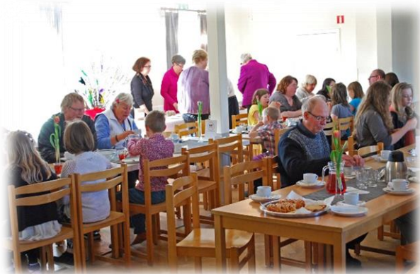
Samkväm i Bygdegården Palmvändagen